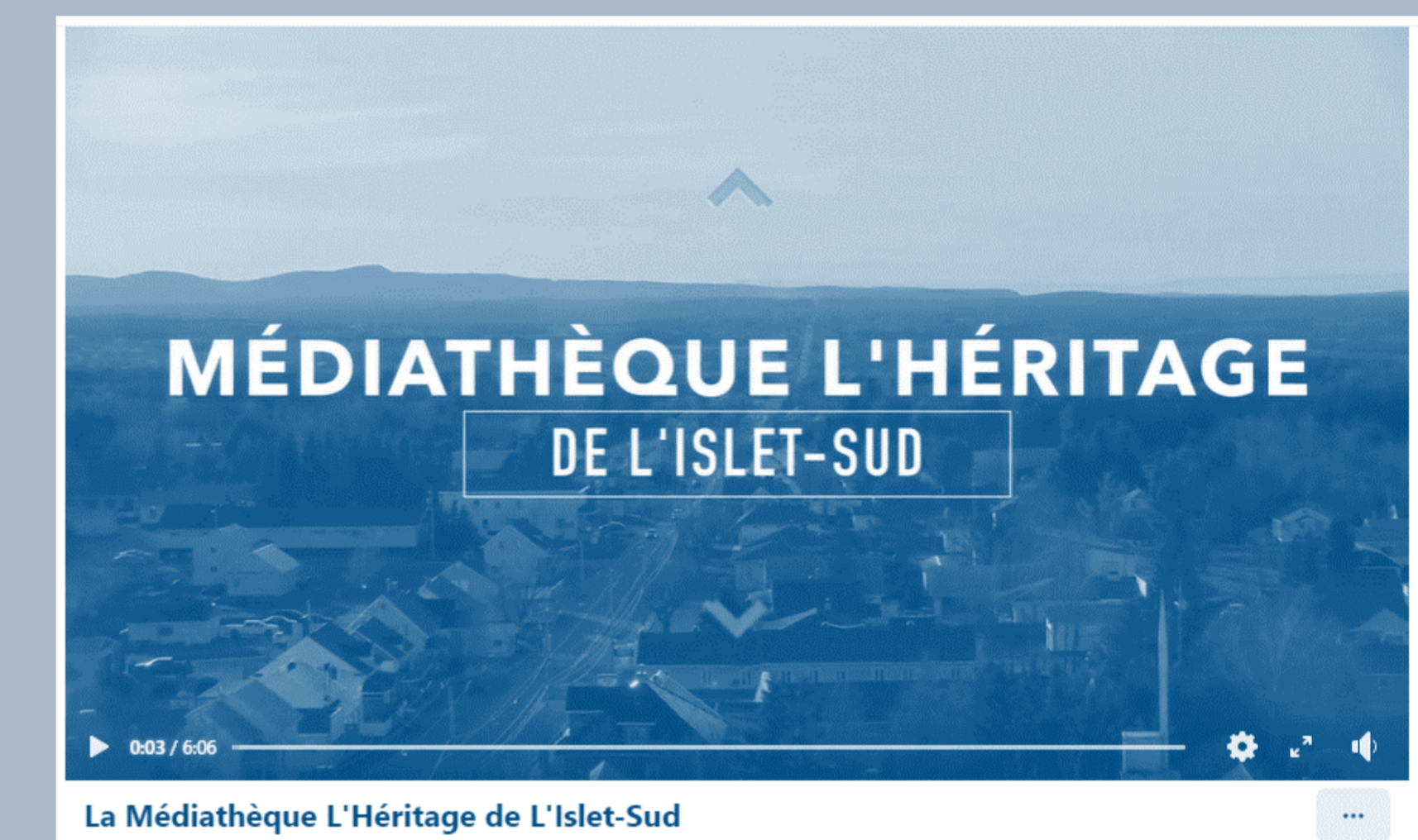
La Médiathèque L'Héritage de L'Islet-Sud

https://www.facebook.com/mediathequeheritage/videos/la-mediathèque-lhéritage-de-lislet-sud/43209874752153/